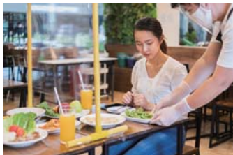
ホテル・レストラン・店舗