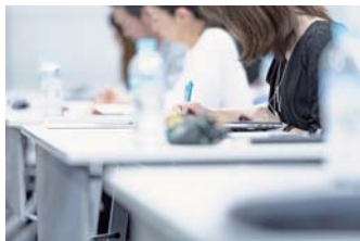
シェアオフィス・会議室