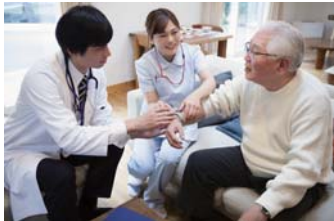
病院・高齢者施設