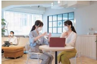
児童施設・学習塾・学校